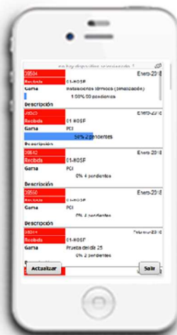
Pantalla de incidencias asignadas y tareas que debe hacer de la gama